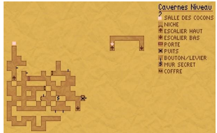
Cavernes niv2 chemin Emeraude

* Chemin saphir : insérez le saphir dans la tête Nord et allez d'abord jusqu'au coffre au sud en passant le tourniquet. Crochetez-le ou fracassez-le. Revenez tout droit vers nord puis après le coin forcez dans le mur secret (vous passez à travers).