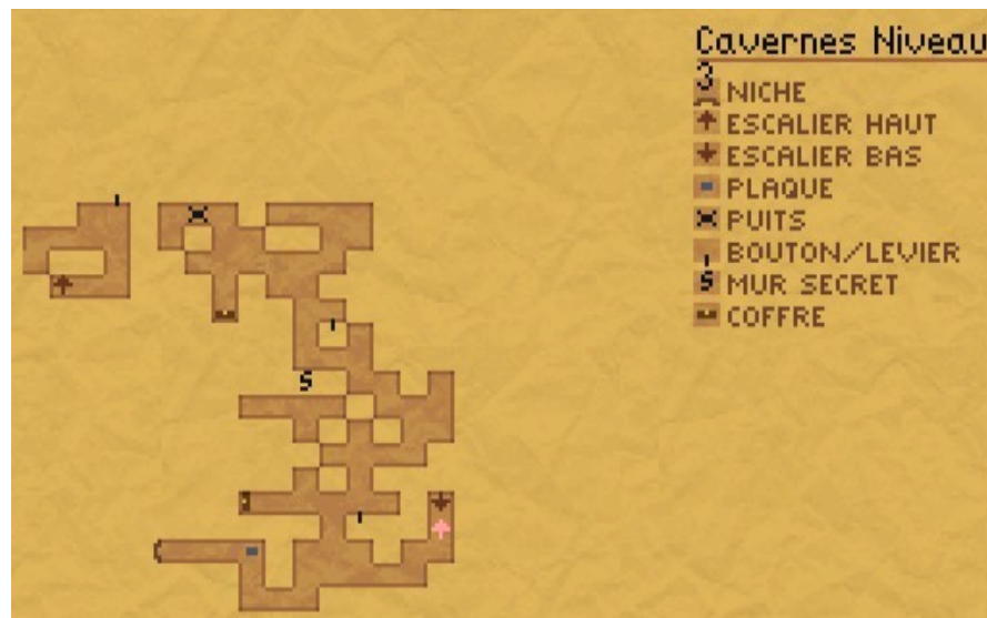
Cavernes niv 3 chemin Saphir