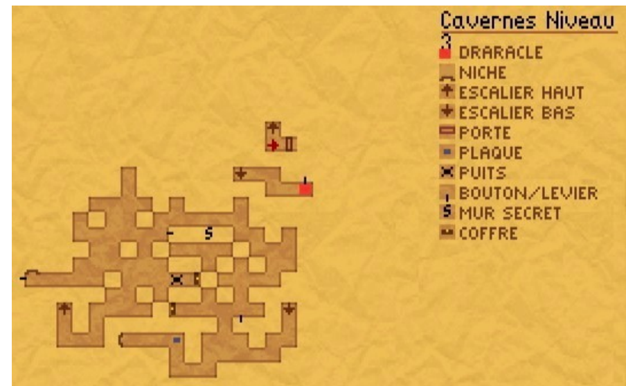
Cavernes niv 3 chemin Emeraude