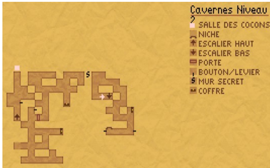
Cavernes niv2 chemin Saphir